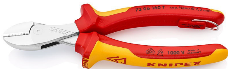
73 06 160 T X-Cut®